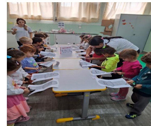
Atividade 3: Explorar