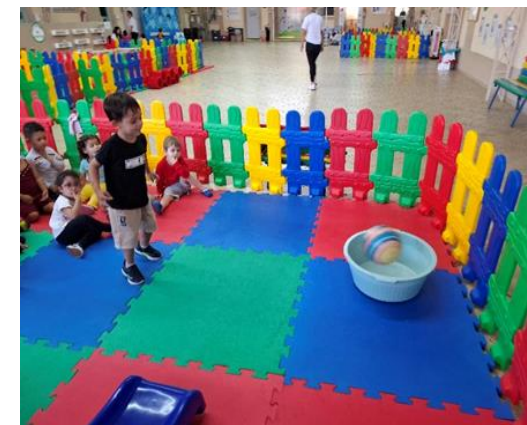
Atividade 5: Conhecer