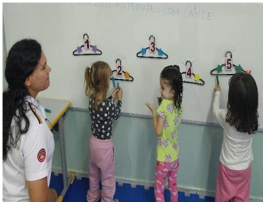
Atividade 2: Participar